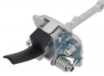
Oe Ref: 6E0837249C KAPI GERGİSİ AROSA ( 1997 - 2004 ) ÖN SAĞ , ÖN SOL