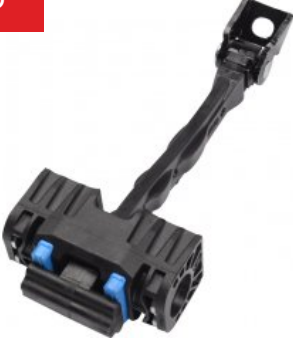
Oe Ref: 7N0 837 249 KAPI GERGİSİ ALHAMBRA III 2011- ÖN SAĞ , ÖN SOL